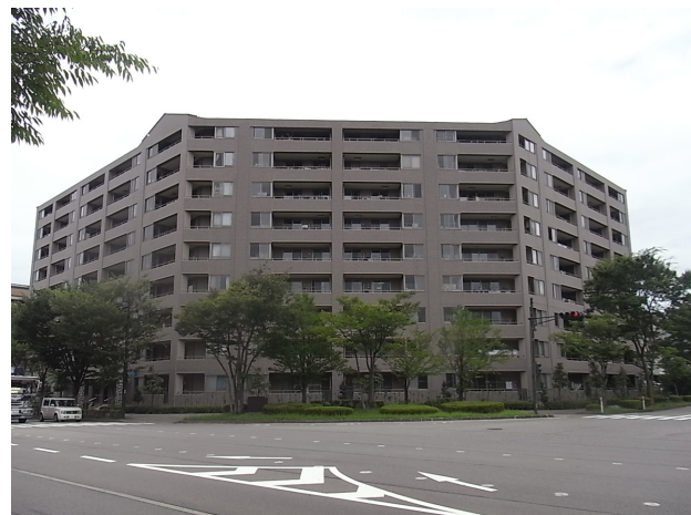
建築年月：2001年6月(築19年)

イオンもりの里まで徒歩1分！！ベランダからは金沢の四季を堪能できます。 令和元年に、クロス・床を貼替え、カーテン交換、トイレを新設したきれいなお部屋です。