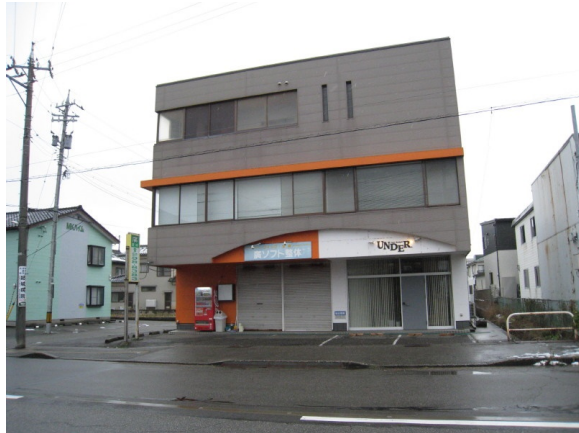
建築年月：1987年11月(築33年)

シンプルで使いやすい事務所です。角部屋で窓が多く、明るく開放的な室内で、仕事がかどりますよ。