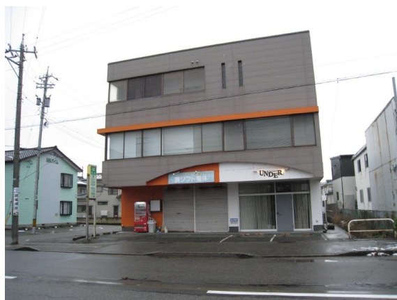
建築年月：1987年11月(築33年)

シングル向けの1DKタイプ！かわいいペットと暮らせるペット可物件♪広すぎず、掃除や片付けもラクチンです。窓が多くて通気性も良く、日当たりの良い角部屋です。